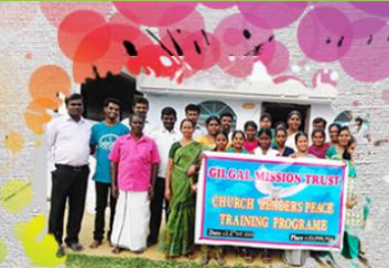
Education à la paix et à la résolution des conflits