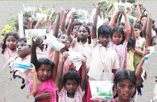
Education des enfants