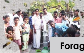
Forage de puits