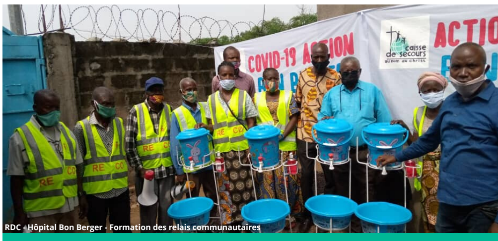
RDC - Hôpital Bon Berger - Formation des relais communautaires