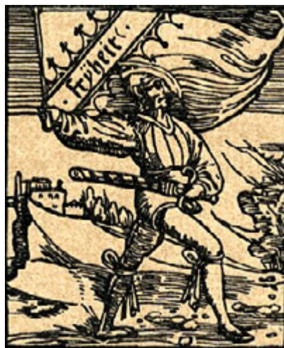
Un porte-drapeau de la Guerre des paysans de 1525, avec la mention « Frjheit/liberté »