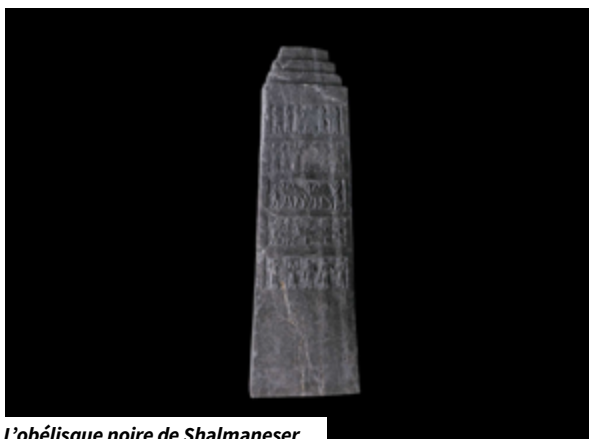
L'obélisque noire de Shalmaneser

Le mandat commence avec Dieu qui dit : « Faisons l'être humain comme une image de nous, qu'il soit maître de tous les animaux. » Puis « Il les créa à son image et les bénit en disant : peuplez la terre et dominez-la ». Il semble y avoir un lien entre le fait d'être l'image de Dieu et celui de dominer. À la question « qu'est-ce que Dieu attend de son peuple ? », ces versets proposent comme réponses : 1) d'être à l'image de Dieu, 2) de dominer/être le maître.