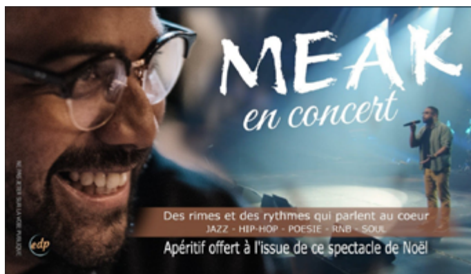
En 2024, l'église des Perches avait accueilli un concert de Noël du rappeur chrétien Meak.