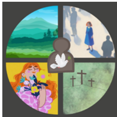
Illustration : Salomé Richir-Haldemann

Puis tisane, gâteaux, ping-pong, discussions, jeu de cartes et autres jeux en tout genre pour passer encore de bons moments d'échanges.