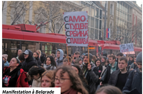
Manifestation à Belgrade

YouVersion, l'application biblique la plus diffusée au monde, a franchi son milliardième téléchargement durant ce mois de novembre 2025. Créée en 2007 par Bobby Gruenewald, de l'Église Life.Church (Oklahoma, États-Unis), elle s'est imposée dès 2008 comme la première Bible mobile. Elle propose aujourd'hui plus de 3 500 versions de la Bible dans 2 300 langues, des versions audio, des outils de lecture et de méditation, ainsi que le populaire « verset du jour ». L'application, aussi appelée The Bible App , est disponible gratuitement sur tous les stores et sur bible.com. Pour beaucoup, elle remplace la Bible imprimée. Basée à Edmond (Oklahoma), YouVersion emploie plus de 200 salariés et 3 000 bénévoles. Sans publicité, elle est financée par des dons. Christian Today