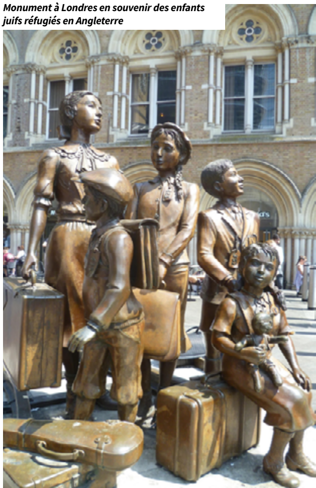
Monument à Londres en souvenir des enfants juifs réfugiés en Angleterre